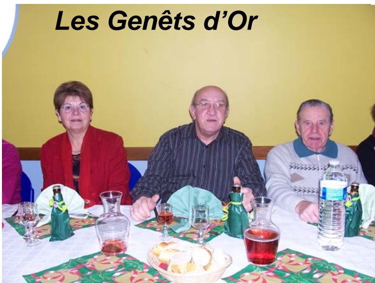
Réunion club deuxième et quatrième mercredi du mois, à la salle des fêtes de St Martin d'Heuille.