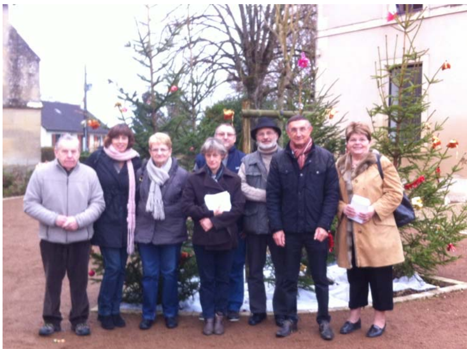
Les membres du CCAS partent distribuer les cartes cadeaux aux heureux bénéficiaires de la commune quelques jours avant Noël.

Pour respecter la démocratie, le C.C.A.S. a consulté les concitoyens concernés par l'opération 'cadeau de Noël' pour connaître leur préférence entre un repas, un panier garni, ou un chèque cadeau. Les réponses à cette enquête ont été nombreuses et le chèque cadeau a été plébiscité par une très large majorité de personnes, loin devant l'invitation à un repas ou un panier garni. Dont acte ; les membres du CCAS ont distribué les chèques cadeaux aux aînés le samedi 20 décembre, juste à temps pour Noël. Ils ont été chaleureusement accueillis par les heureux bénéficiaires.