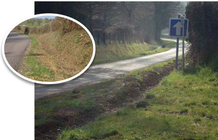
Nettoyage des fossés rue des Crapauds (et route de Nevers, en médaillon)

Entretien préventif de la voirie par le curage régulier des fossés