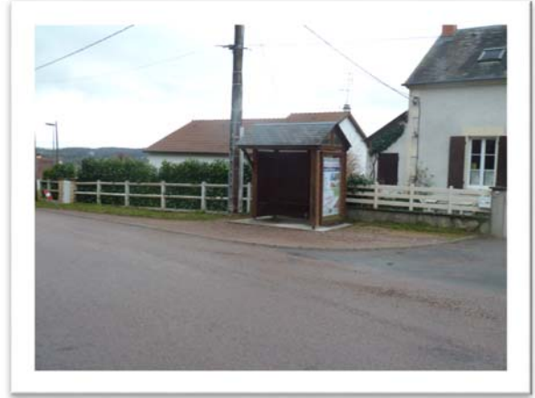
Route de Nevers, au Guidon

Entretien préventif de la voirie par le curage régulier des fossés