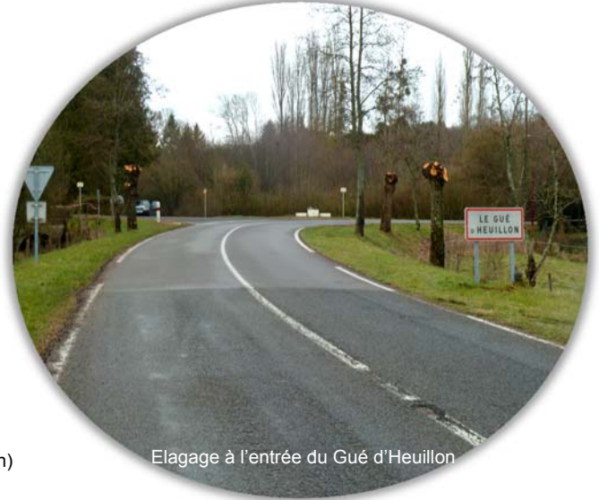
Elagage à l'entrée du Gué d'Heuillon

Modernisation et enfouissement des réseaux au Gué d'Heuillon