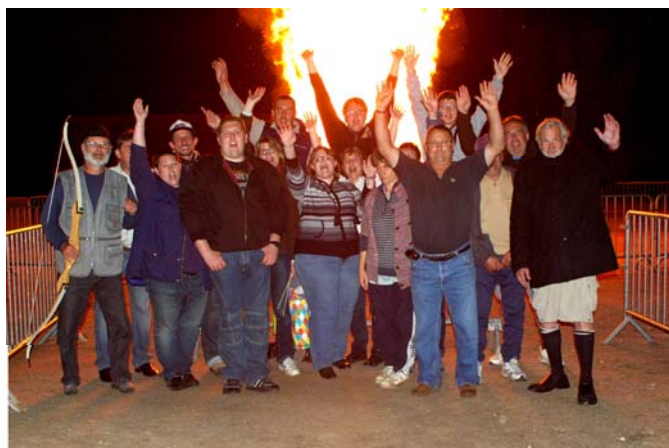
Feu de joie pour clôturer la fête du village en été 2014

Contactez Alain LECROT (président) tél. 03 86 38 56 29