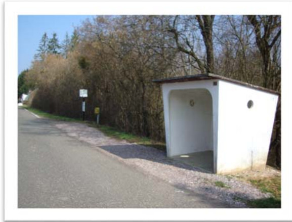
Route du Gué d'Heuillon

Nouvelle implantation des abris bus pour répondre à l'évolution des besoins en matière de transport scolaire